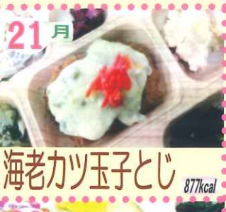
21月 海老カツ玉子とじ 877kcal