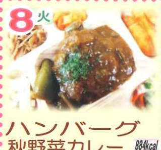
8火 ハンバーグ 秋野菜カレー 884kcal