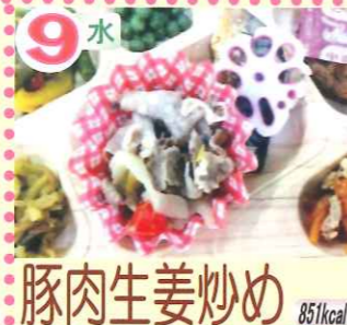
9水 豚肉生姜炒め 851kcal