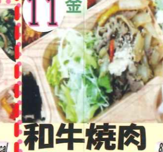
11金 和牛焼肉 888kcal