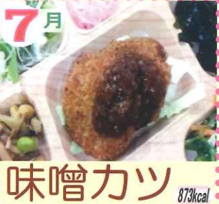
7月 味噌カツ 873kcal