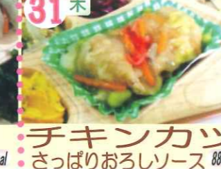
31木 チキンカツ さっぱりおろしソース 885kcal