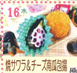
16水 焼サワラ&チーズ南瓜包揚 840kcal