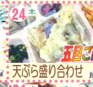
24木 天ぷら盛り合わせ 911kcal