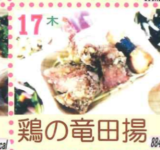
17木 鶏の竜田揚 884kcal