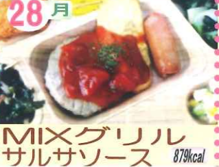
28月 MIXグリル サルサソース 879kcal