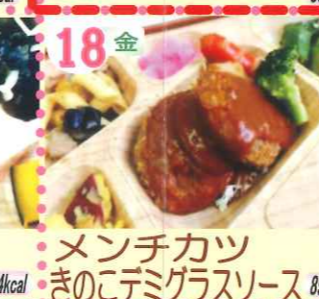
18金 メンチカツ きのことデミグラスソース 896kcal