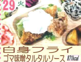
29火 白身フライ ゴマ味噌タルタルソース 871kcal