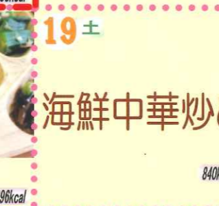
19土 海鮮中華炒め 840kcal