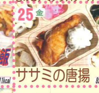
25金 ササミの唐揚 850kcal