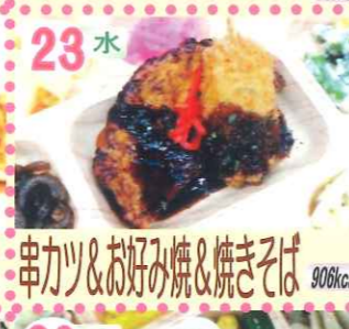
23水 串カツ&お好み焼&焼きそば 906kcal