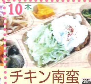
10木 チキン南蛮 895kcal