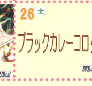
26土 ブラックカレーコロケ 890kcal