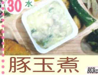
30水 豚玉煮 863kcal