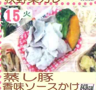
15火 蒸し豚 香味ソースかけ 843kcal