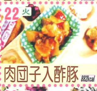
22火 肉団子入酢豚 882kcal